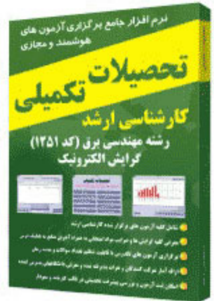
گرایش الکترونیک - کد ۱۲۵۱