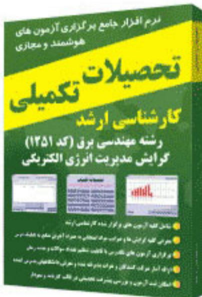
مدیریت انرژی - کد ۱۲۵۱