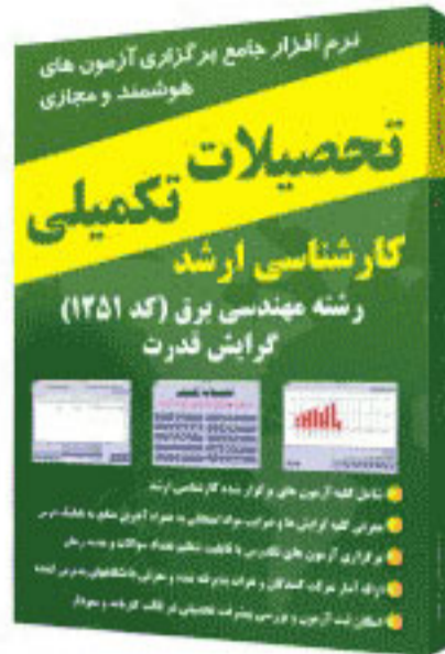
گرایش قدرت - کد ۱۲۵۱