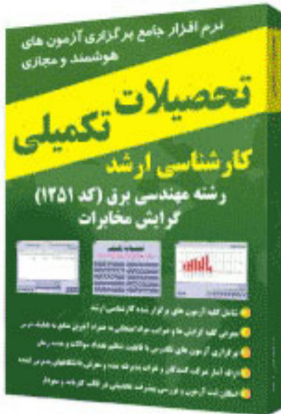
گرایش مخابرات - کد ۱۲۵۱