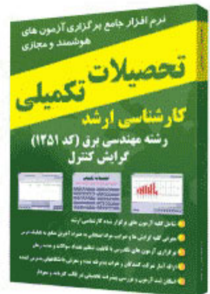
گرایش کنترل - کد ۱۲۵۱